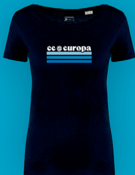
Samarreta casual CE Europa