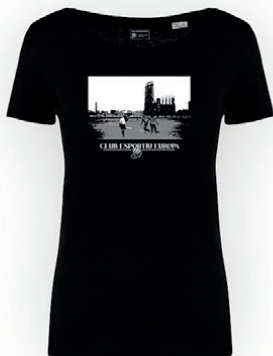
Samarreta Sagrada Família retro