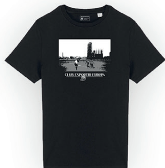
Samarreta Sagrada Família retro