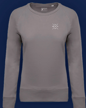
Dessuadora casual CE Europa