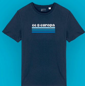
Samarreta casual CE Europa