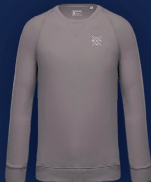
Dessuadora casual CE Europa